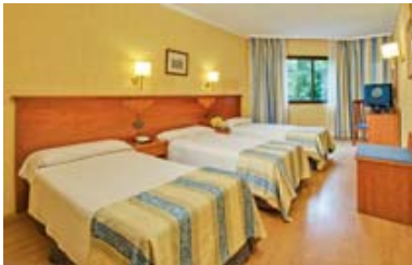
servicios necesarios para una estancia